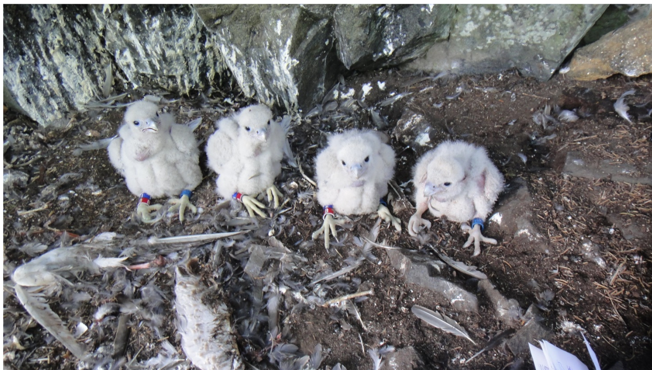
En fyrkull som precis har blivit ringmärkt, vägd och välsignad.