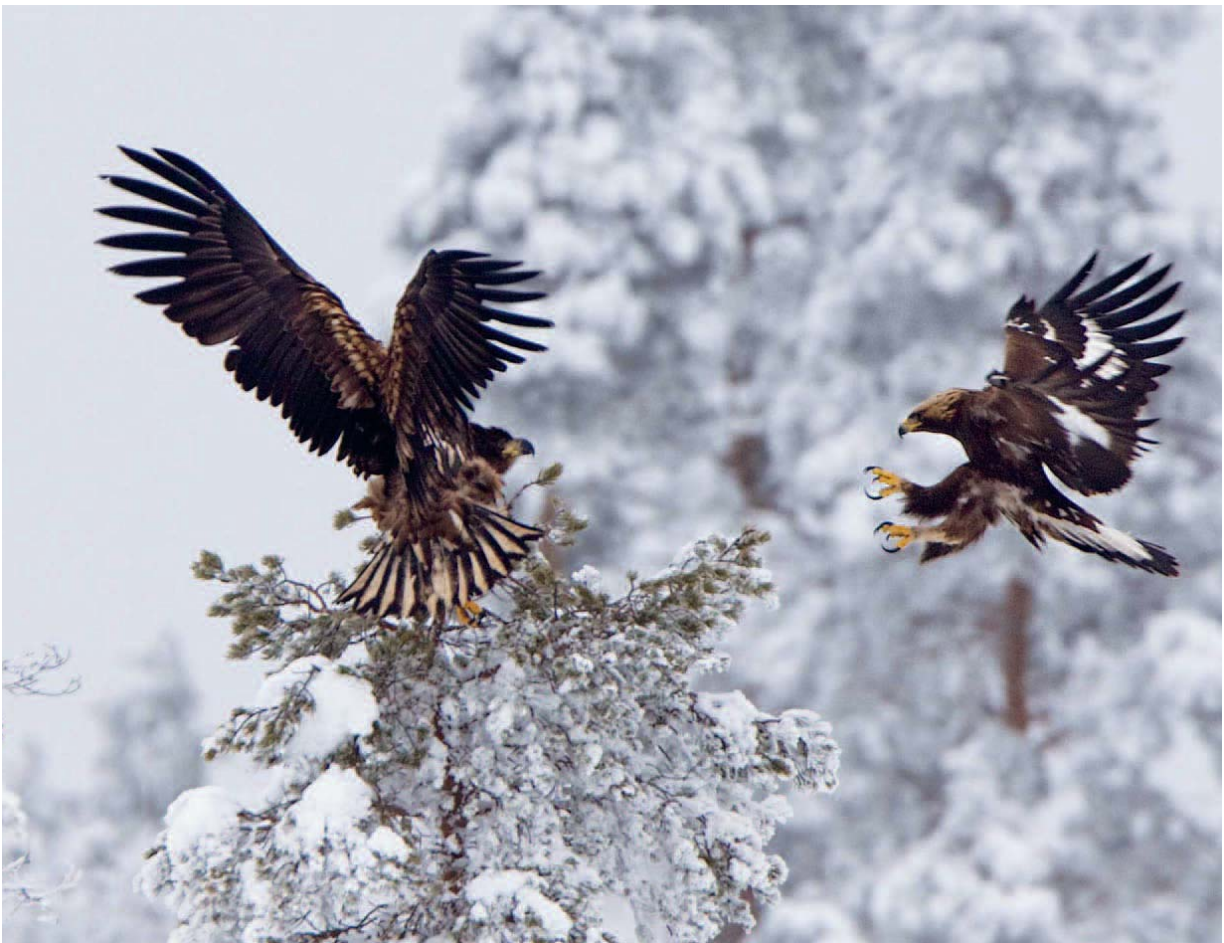
Havsörn ( Haliaeetus albicilla) i mötet med en lika stark motståndare kungsörnen ( Aquila chrysaetos)