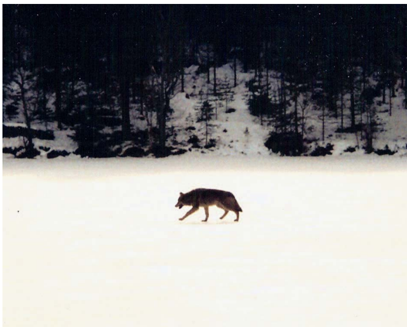
Hannen i Långsjöreviret

Detta kommer att leda till onödigt besvär och olägenheter för djurhållare och småviltsjägare i området.