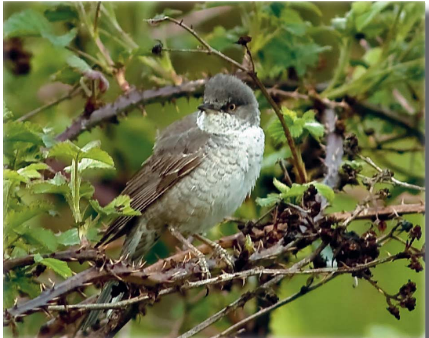
Höksångare!