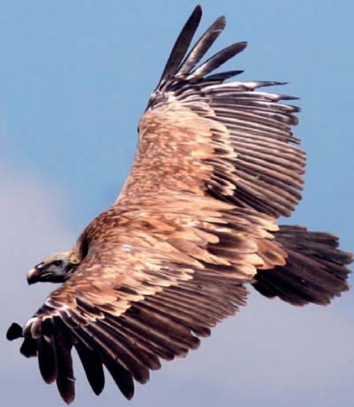
Gåsgam ( Gyps fulvus )