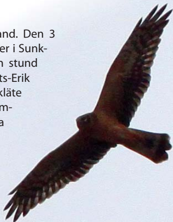
Stäpphök över Limsjön