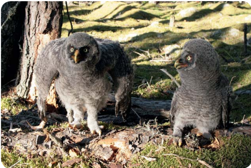
Lappuggla ( Strix nebulosa )

Lappugglorna hade ett bra år med 5 häckningar, och 2 av dessa var på plattformar, som byggts för just lappuggla, och 3 bodde i naturliga bon. 12 lappuggleungar ringmärktes.