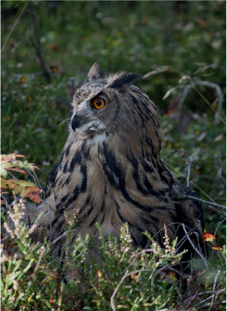
Berguv ( Bubo bubo ) Båda bilderna!