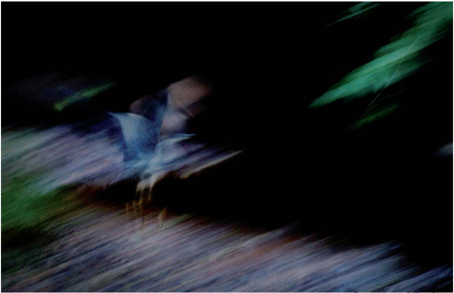
Illusion av en häger.

Mitt emot där jag satt på andra sidan ån dök det plötsligt upp ett litet ansikte bland stenarna och innan jag han registrera vad det var för något var det borta. Vred kameran och kikade genom sökaren. Titt ut! Och så försvann det igen.