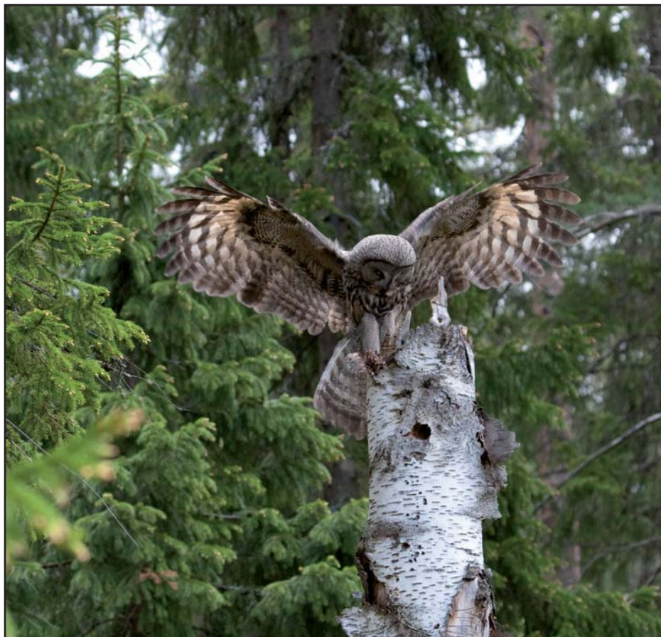
Lappuggla ( Strix nebulosa )