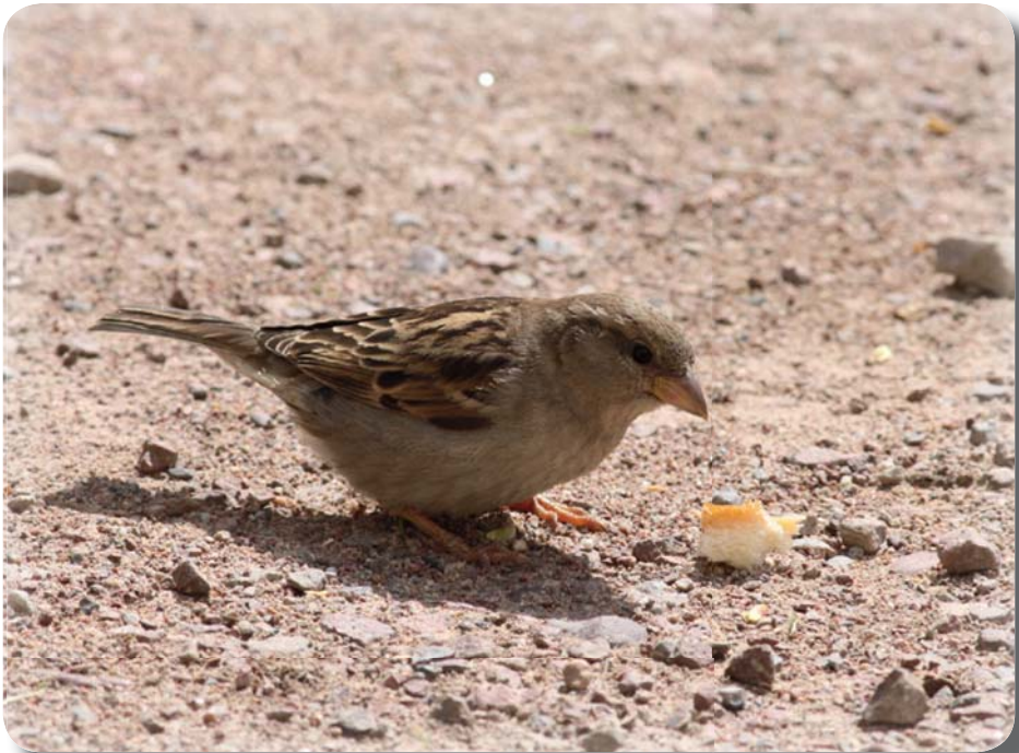
Hona Gråsparv

Gråsparvarna är typiska flockfåglar året runt och även under häckningstid. I det fallet liknar de sina släktingar vävarefåglarna i Afrika. Efter häckningen drar de runt i större eller mindre flockar men de avlägsnar sig inte särskilt långt från häckningsområdet. På hösten besöker de regelbundet spannmålsåkrar i närheten och de börjar äta av kärnorna långt innan grödan är skördemogen. Olika ogräsfrön ingår i födan och särskilt maskrosfrön är eftertraktade. På vintern håller de till vid gårdarna och äter spillsäd och andra fröer från träd och buskar. De flyger ofta emellan olika fågelbord och tittar efter var de bästa godbitarna finns. Hampfrö och solrosfrö tycker de bäst om men de äter också gärna av jordnötterna. Om inget annat finns tillgängligt så duger det med havre. Men livet är hårt för sparvarna och de har många fiender. Sparvhöken är deras främsta gissel men ibland försöker även någon duvhökshane överlista dem. Katter tullar också på beståndet och även skatorna lyckas ibland att fånga någon ouppmärksam individ. Men så småningom kommer en ny vår och de som överlevt vintern kommer förhoppningsvis att föra släktet vidare.