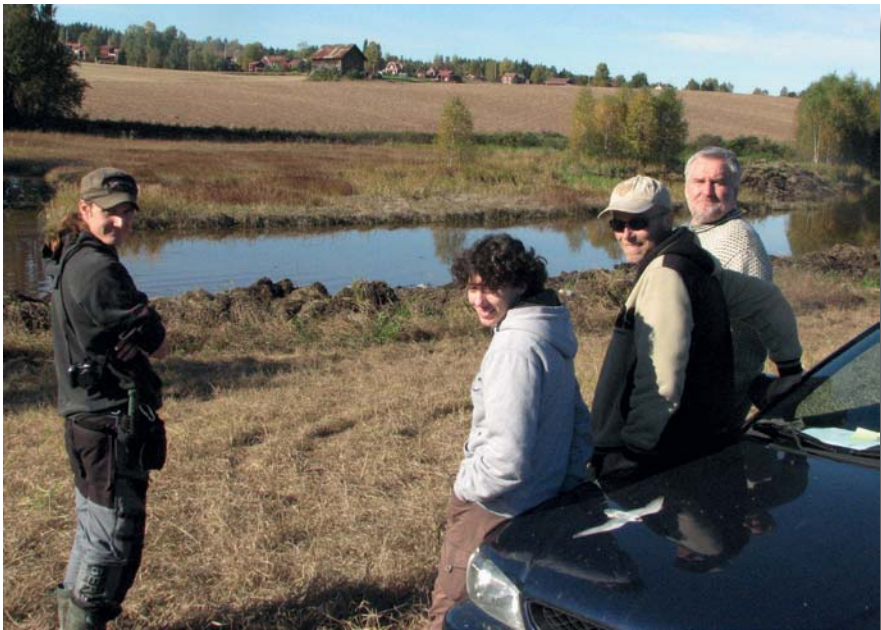
En av bogdans sista utflykter, stenbrotjärn. (Oktober 2010)

Ett stort och varmt tack till alla som ställt upp för den nya Leksands Fågelklubb, som gör att vi kan gå vidare trots all sorg och saknad!